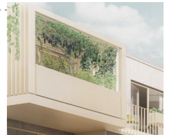
Patio mit Hochbeet (Beispielbild)