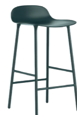
Barstuhl FORM , Normann Copenhagen