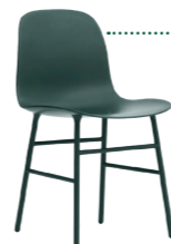
Stuhl FORM , Normann Copenhagen