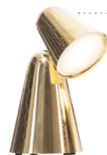
Leuchte PEPPONE Formagenda