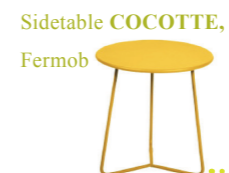
Sidetable COCOTTE , Fermob