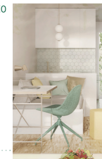
Barstuhl FORM, Normann Copenhagen