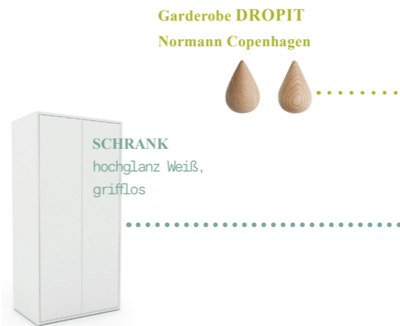
Garderobe DROPIIT Normann Copenhagen