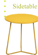
Sidetable COCOTTE, Fermob