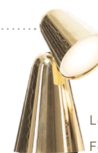
Leuchte PEPPONE Formagenda