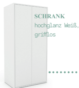
SCHRANK hochglanz Weiß, grifflos