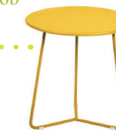
Sidetable COCOTTE, Fermob