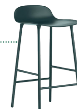
Barstuhl FORM, Normann Copenhagen