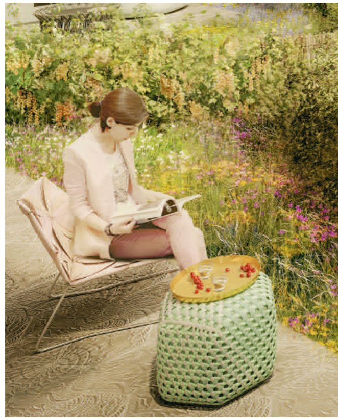
Visualisierung aus Sicht des Illustrators / Beispielbild