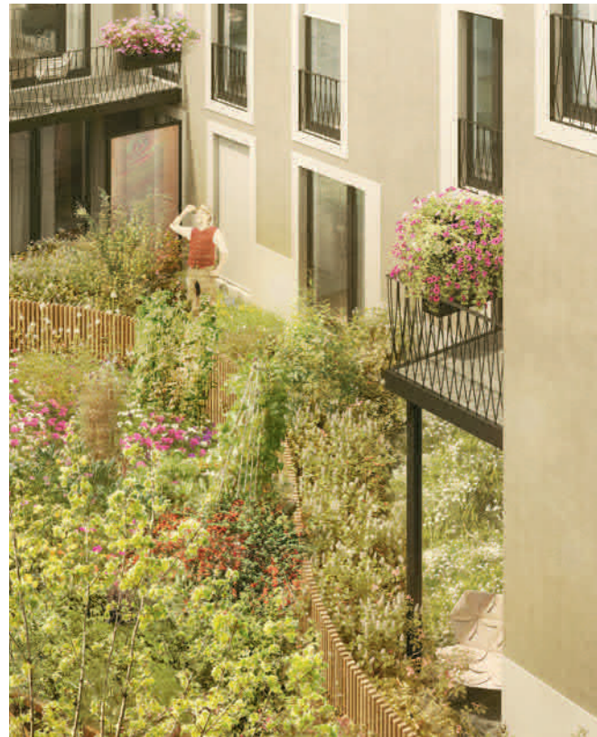
Visualisierung aus Sicht des Illustrators / Beispielbild