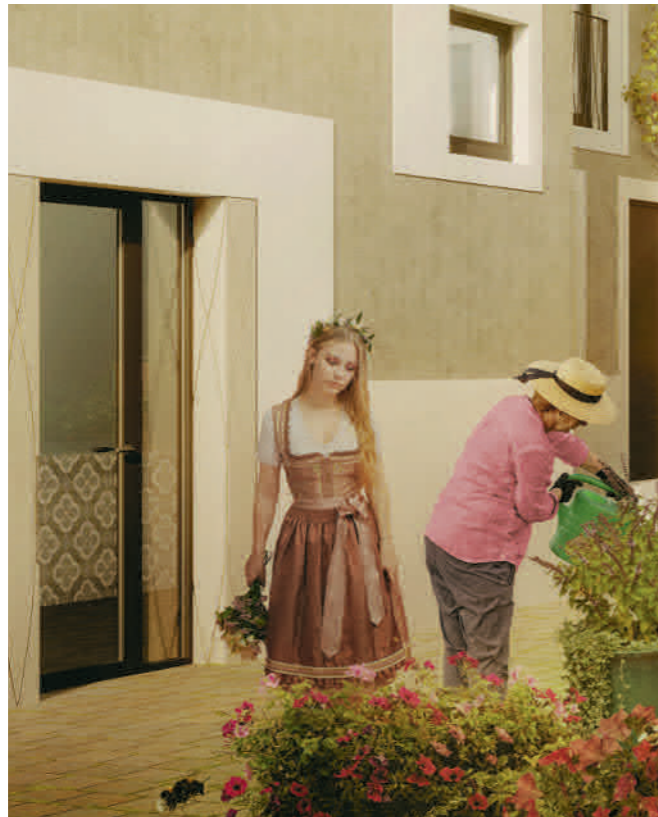
Visualisierung aus Sicht des Illustrators / Beispielbild