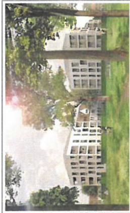
So wird ein weiteres Projekt der BHB in München aussehen

Wohnungen, ein Studentenwohnheim, ein Hotel und Einzelhandelsflächen, ein kulturelles Bürgerzentrum und mehr werden rund um den Hams-Seidel-Platz einen attraktiven und bunten Mittelpunkt schaffen. Die BHB trägt mit der Realisierung von dringend benötigtem Wohnraum durch die Projekte Loge No. 1 und Loge No. 2 einen großen Teil bei.