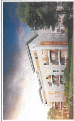
Wo der Fluss Aitel entsteht, die Ateliers in Grafing bei München